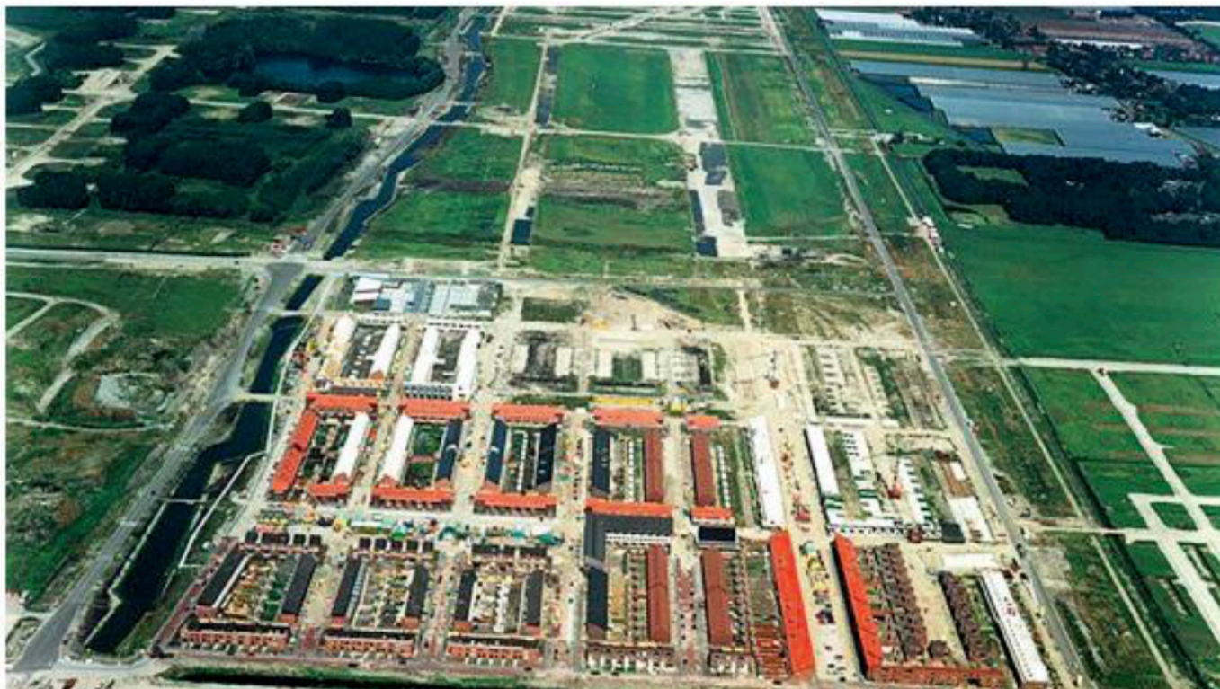
Bouw deelplan Singels met daarboven de restanten van de landingsbaan augustus 1998

Deze rubriek komt tot stand in samenwerking met de Historische Vereniging Buitenplaats Ypenburg (HVBY)